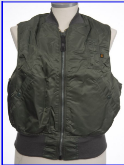
Bomber MA-1 Vest Smanicato Vintage Made in USA